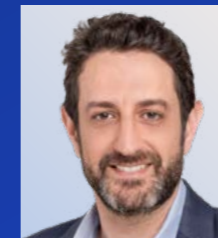
הראל טוב שותף, מיסוי בינלאומי